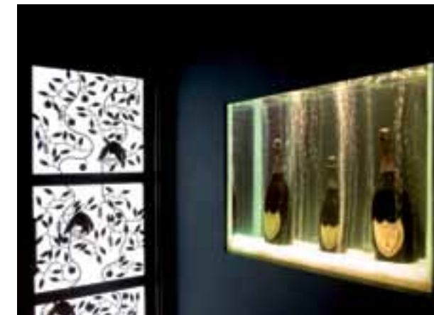
Na entrada, a porta iluminada e um “aquário” fora do comum (acima) dão as boas-vindas ao visitante. À esquerda, o gazebo metálico, permeado por luzes e sombras | In the entrance, the illuminated door and most unusual “aquarium” (above) greet the visitor. At left, the metal gazebo, permeated with light and shadows

arranged — and ends up at the drinks bar, where pendant Sputnik lights dominate the scene. Each of these is equipped with eight incandescent lamps, with silvered bulbs (60W), that throw their light onto the golden pieces of crystal composing the rest of the fitting. On the counter, the intention was to light the counter-top, made of onyx, so as to bring out the translucency so typical of this stone. “The idea was that the horizontal surface, as well as the vertical, should display transparency, and this presented a challenge. What we did, in the end, was to back-light the counter-top (T2 fluorescent lamps, 3000K) and make the stone seem almost to float: what joins the top to the counter are little transparent acrylic feet, so that the supporting structure is not visible,” Monica explains.