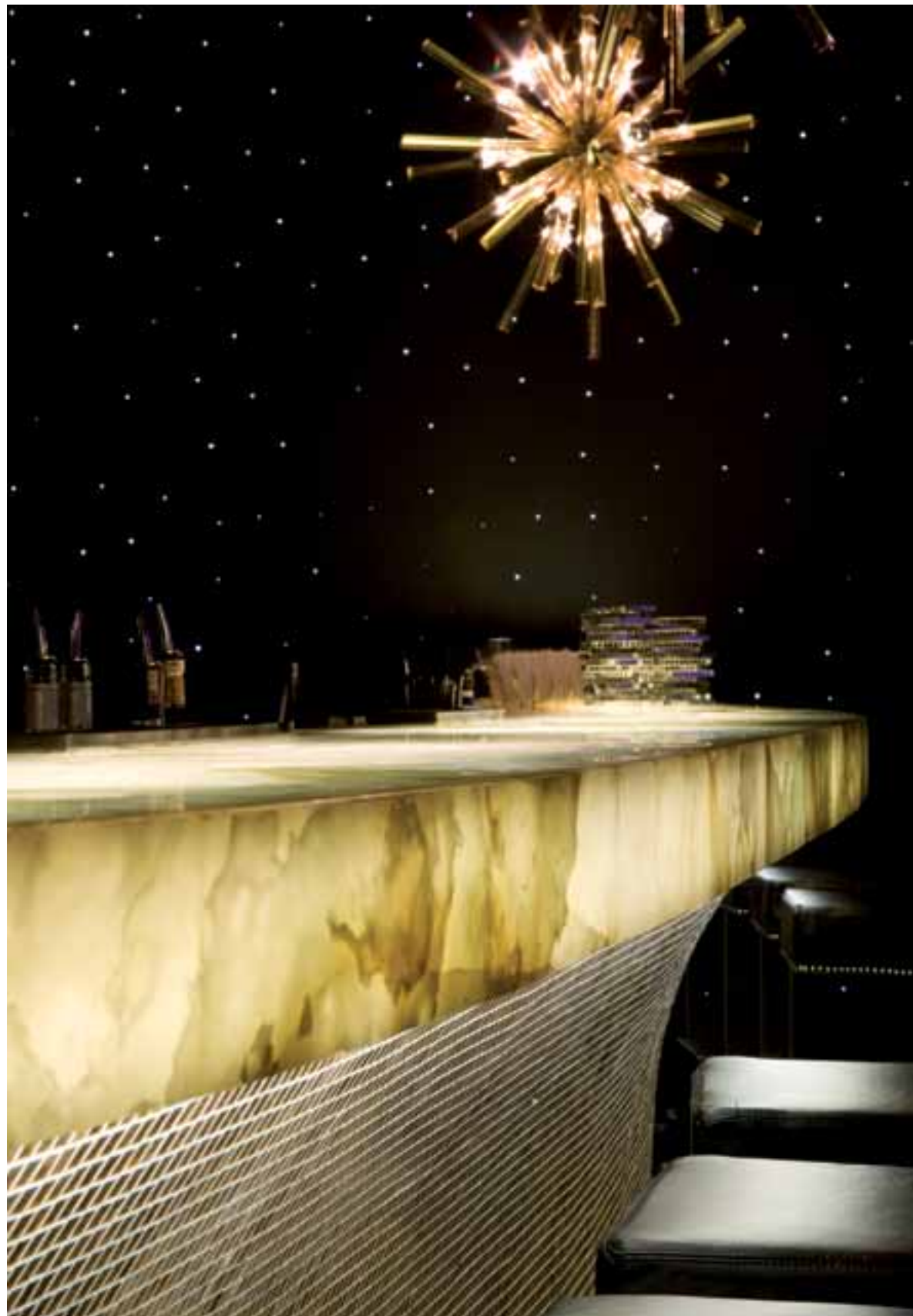
Detalhe do balcão do bar: a iluminação sob o tampo ressalta a transparência do mesmo, além de valorizar a textura das pastilhas douradas que revestem a base do balcão | Detail of the bar counter: the lighting beneath the counter-top brings out its transparency, as well as enhancing the texture of the golden mini-tiles covering the counter base