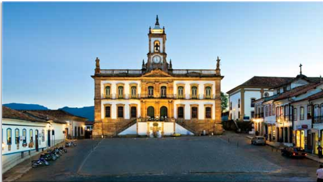
Vista da fachada frontal do edifício. Tonalidade da iluminação se mimetiza com a do entorno.

por uma reforma e restauração, além da reformulação interna e reestruturação da exposição permanente.